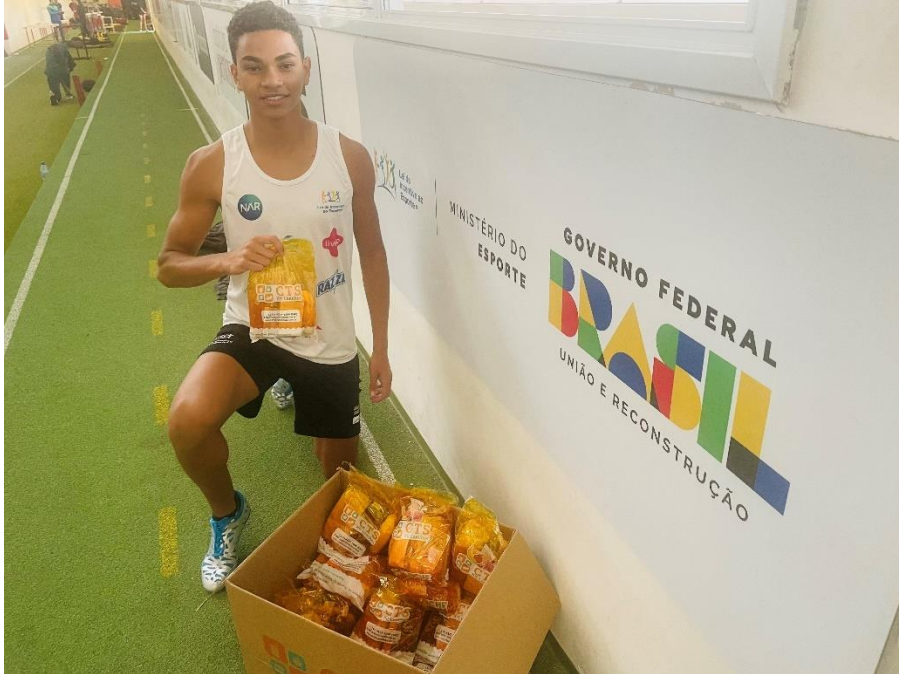
Figura 3 – Entrega de lanches