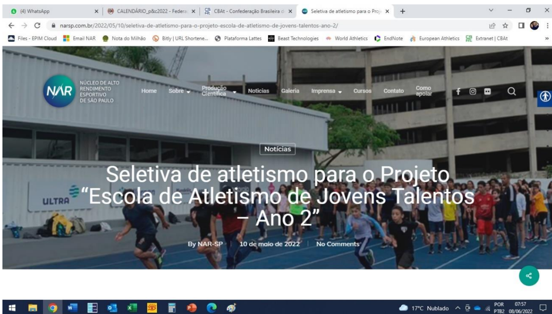
Figura 2 – Divulgação no site sobre a Seletiva de Atletismo