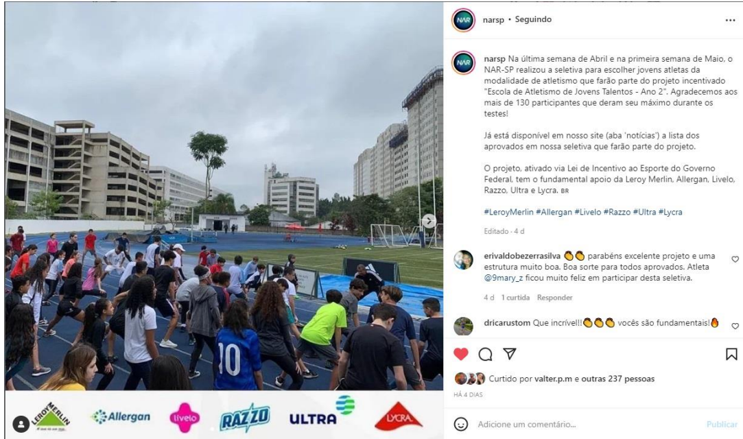
Figura 3 – Post de divulgação sobre a lista de aprovados