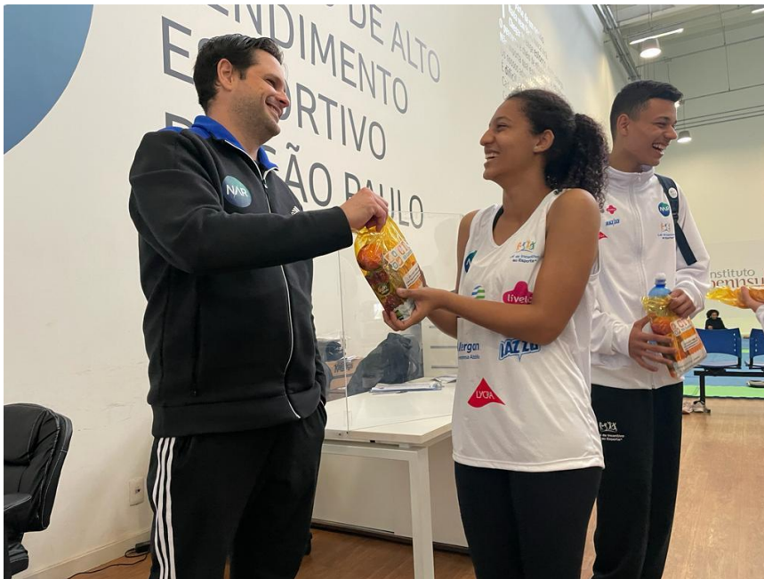
Figura 1 – Entrega de lanche