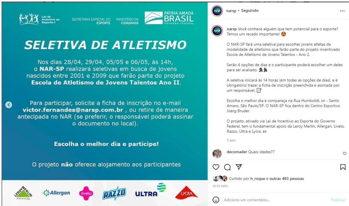
Figura 1 – Post de divulgação da Seletiva de Atletismo para o Projeto