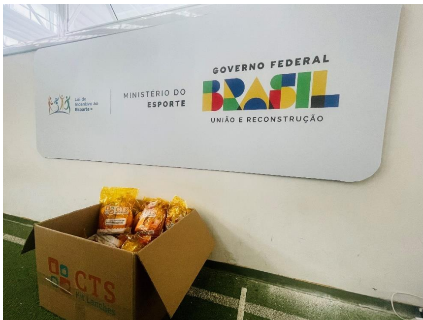
Figura 2 – Caixa de lanches