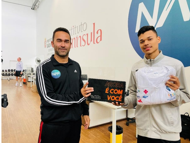
Figura 5 – Entrega de uniforme de treino e sapatilha