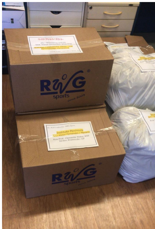
Figura 4 – Caixas de uniformes