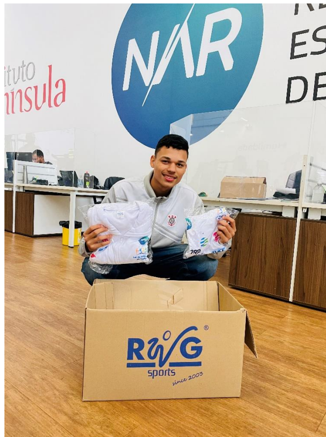
Figura 6 – Entrega de uniforme de treino